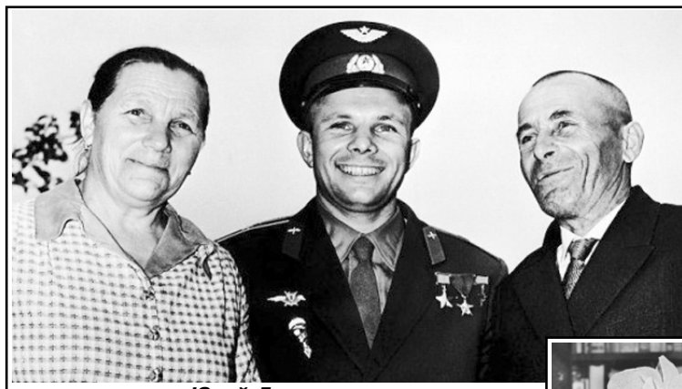
Юрий Гагарин с родителями.

37. Первый приезд Юрия Гагарина в Рязань случился осе-