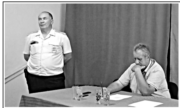
И. БАРИШНИКОВА. Фото автора.