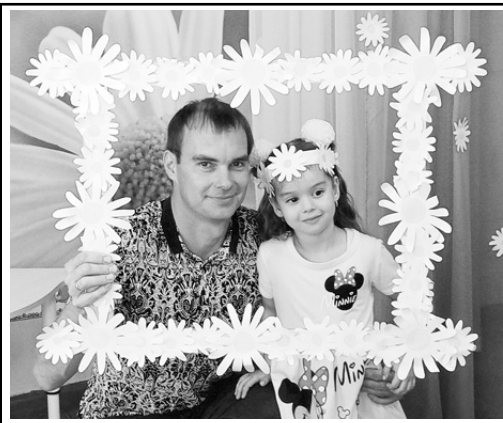
И. ВАСИЛЬЕВА. Фото автора.

Кульминацией праздника стала общая и семейная фотосессия, результатом которой были красивые, яркие, очень классные памятные фотографии.