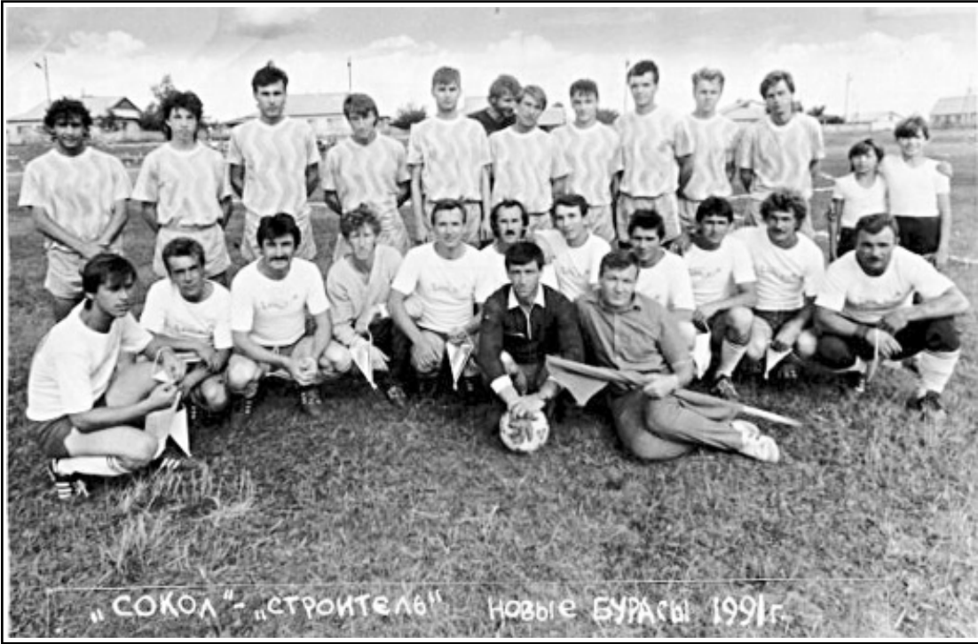
«СОКОЛ» – «СТРОИТЕЛЬ» НОВЫЕ БУРАСЫ 1991г.

В истории новобурасского футбола среди взрослых было много побед над сильными командами Саратовской области. Например, обыгрывали город Аркадак, Базарный Карабулак и другие. Как-то мне попалась на глаза фотография после футбольного матча «Сокол» (Саратов) – МПМК «Строитель» (Новые Бурасы). В то время МПМК «Строитель» был лидером в строительной отрасли района и входил в тройку лучших строительных организаций области, при этом работающие активно занимались спортом – волейболом, баскетболом, футболом. Вроде бы это было совсем недавно, летом 1991 года, участники этого матча были молодыми, амбициозными, но время летит очень быстро, и мы должны помнить свою историю, историю Новобурасского спорта.