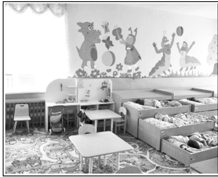
Подготовил И. ПОПКОВ.