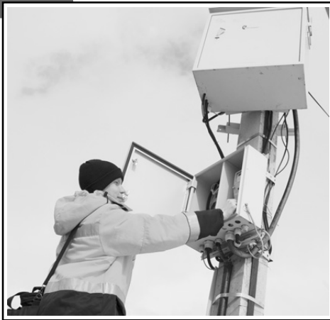
Подготовил И. ПОПКОВ.

сеевки и Тепловки, наравне с городскими жителями, смогут пользоваться цифровыми услугами на высокой скорости. Станут доступны государственные порталы, образовательные платформы для учащихся.