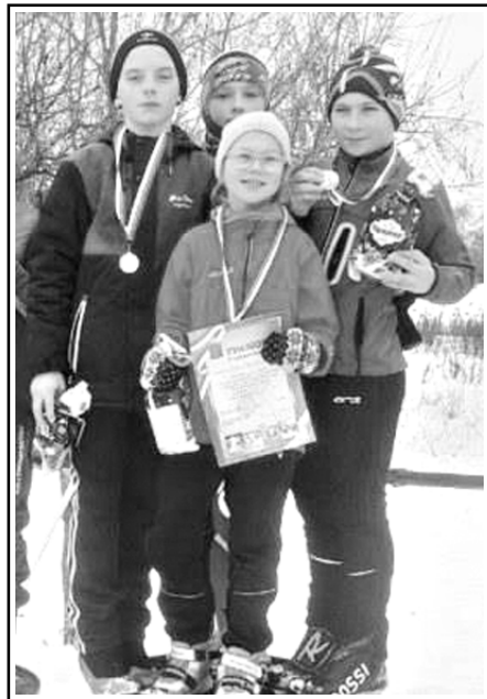
Перед стартом главный судья объяснил все нюансы гонки и пригласил на старт участников забега.

сказуемые старты, ведь во время забега может произойти что угодно: неправильная передача, сломанная палочка в узком коридоре, все это могло случиться с каждым участником.