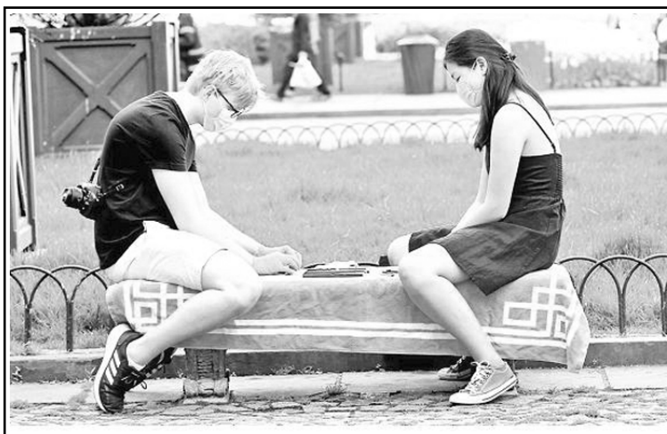
социального дистанцирования. Допускаются занятия физкультурой и спортом на открытом воздухе при условии совме-

Их деятельность возможна при соблюдении требований пребывания потребителей из расчета 4 кв. метра на одного человека и при условии соблюдения санитарно-противоэпидемических мероприятий, дезинфекционного режима и