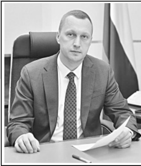
По материалам телеграм-канала Романа БУСАРГИНА.

ров для ребят обеспечили зарплатой и всем необходимым, а где по-прежнему уделяют этому направлению недостаточно внимания, — рассказал губернатор Саратовской области Роман Бусаргин.