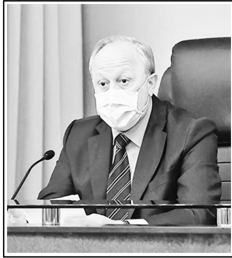
«Жесткий масочный контроль должен быть там, где высоки риски заражения и

Губернатор Валерий Радаев на заседании Координационного совета по противодействию распространению коронавирусной инфекции отметил стабильность ежедневной статистики заболеваемости.