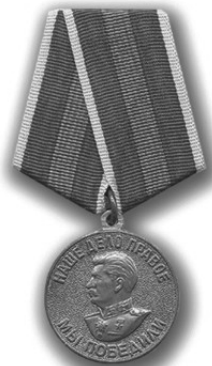
За доблестный труд в Великой Отечественной войне (1941-1945)

Ходили в госпитали к раненым, писали письма под диктовку их родным, устраивали для них концерты, даже акробатические номера показывали. Бойцы угощали кусочком сахара. Они делились последним. Это