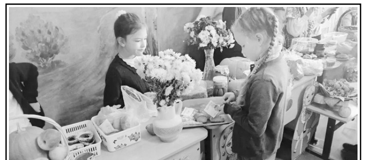
МОУ «СОШ № 1 р. п. Новые Бурасы».