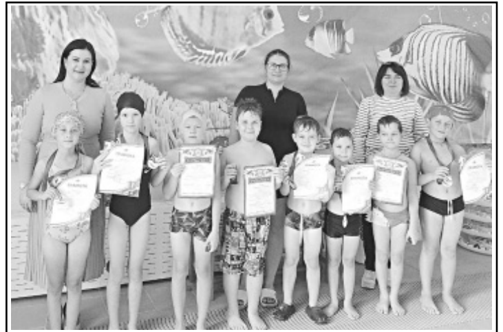
По материалам МОУ «Школа № 2 р. п. Новые Бурасы».