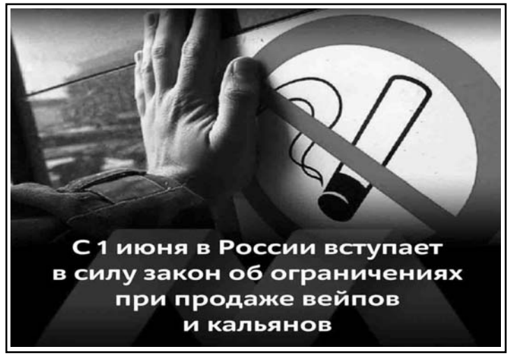
С 1 июня в России вступает в силу закон об ограничениях при продаже вейпов и кальянов

объекта, службы безопасности, органов милиции. Не пытайтесь заглянуть внутрь подозрительного пакета, коробки, иного предмета.