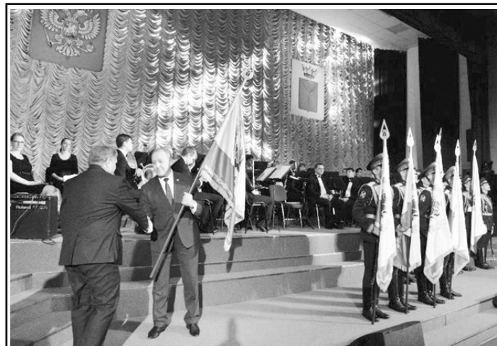
По итогам работы за 2016 год СХПК «Штурм» был вручен переходящий Штандарт Губернатора Саратовской области