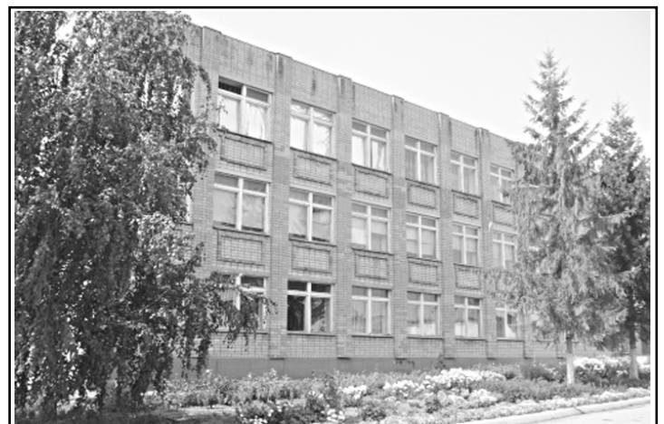
МОУ «СОШ № 1 р. п. Новые Бурасы»