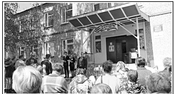
МОУ «СОШ п. Динамовский»