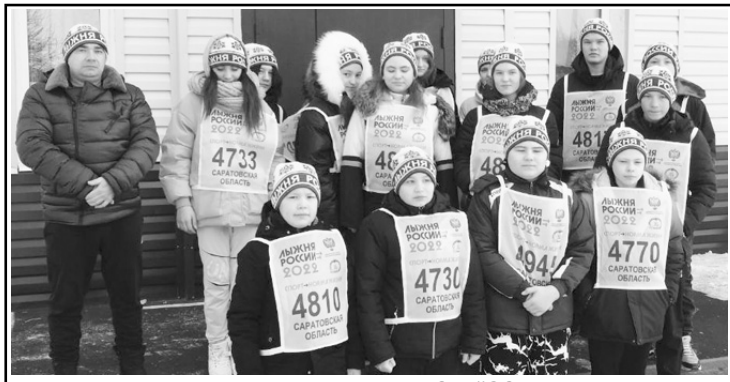
Учащиеся МОУ «СОШ п. Белоярский»

ми из других районов и областей, а также мы можем сравнить свой уровень тренированности среди других спортсменов.