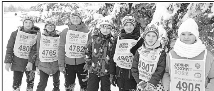
Обучающиеся Центра развития дополнительного образования р. п. Новые Бурасы

Почти каждые выходные мы выезжаем на различные соревнования по лыжам, где получаем огромный заряд энергии, общения с друзья-