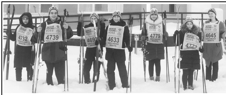
Учащиеся МОУ «СОШ «Созвездие» с. Тепловка»