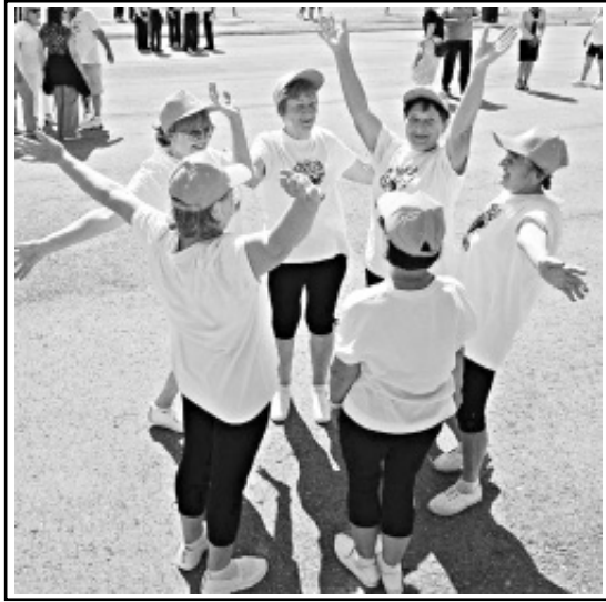
Все участники получили положительные эмоции, заряд энергии на свежем воздухе и хорошее настроение.

Нужно двигаться, укреплять свое здоровье, жить активно и долго, что и показали наши "серебряные" волонтеры.