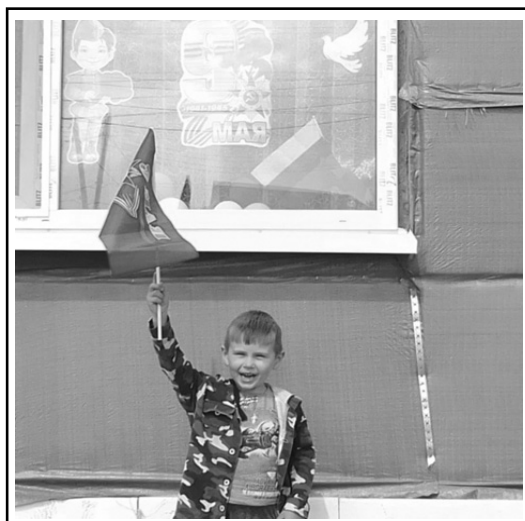
Подготовила И. БАРЫШНИКОВА.

Постановлением Правительства Российской Федерации от 10.03.2023 № 372 внесены изменения в постановление Правительства Российской Федерации от 10.03.2022 № 336, которым установлены ограничения при проведении проверок, установив новые правила проверок до 2030 года.