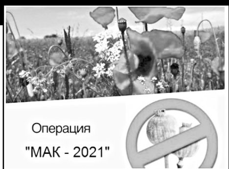
Операция "МАК - 2021"