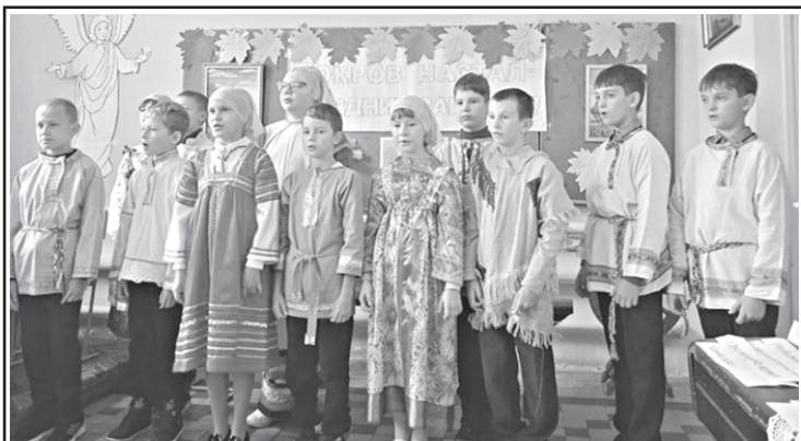
Престольный праздник Покрова Пресвятой Богородицы