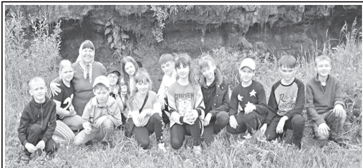
Село Гремячка у Плачущей стены