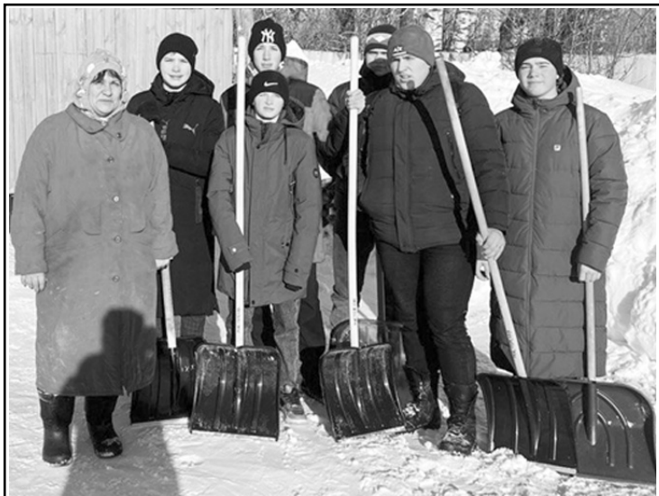
среди тем, кажущимися главными, теряется тема милосердия, ускоренный ритм жизни, свои проблемы, компьютеры и интернет заменили простое человеческое общение, меньше внимание уделяется подросткам, и они порой проявляют жестокость

и агрессивность по отношению к пожилым гражданам. Главное в воспитании подрастающего поколения научить милосердию, состраданию, сочувствию и простому человеческому общению и заботе о пожилых и инвалидах.