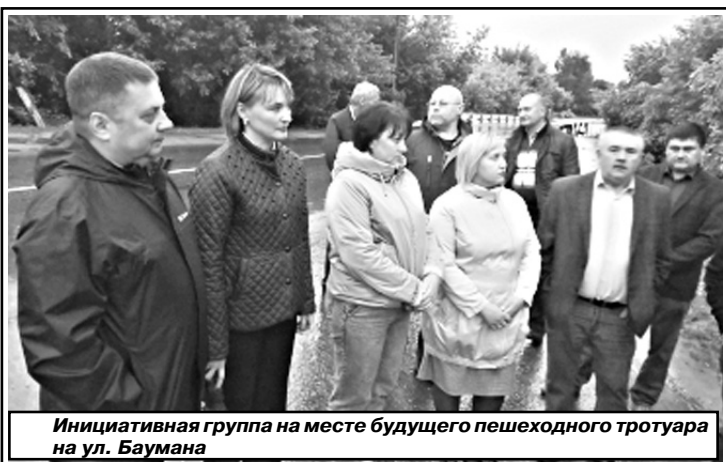
Инициативная группа на месте будущего пешеходного тротуара на ул. Баумана

спикера Госдумы Вячеслава Володина и в ближайшее время поступят в местный бюджет.