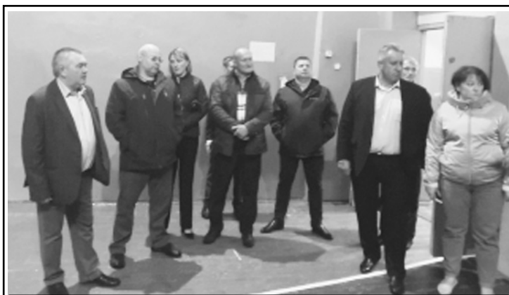
Общественники района осматривают спортивный зал СОШ № 1

В ближайшее время в райцентре начнутся работы по благоустройству, в том числе – ремонт и строительство тротуара на улице Баумана. Старая, пришедшая в негодность, дорожка вдоль проезжей части будет заменена на современный удобный пешеходный тротуар. По центральной улице передвигаются тысячи новобурасцев и именно их желание легло в основу решения строительства такого тротуара. Новый пешеходный переход появится и в районе школы № 2 – от ул. Кирпичной к учебному заведению. Сегодня этим дорожным участком пользуются и ученики, и родители, и педагоги, и жители пос. Северный. Несомненно, это правильное и давно назревшее решение. Обсуждается и строительство тротуара в п. Белоярский от проезжей части к школе населенного пункта. Сейчас школьники вынуждены ходить по траве и грунту, что, конечно же, следует изменить. Еще один пешеходный современный переход облегчит жизнь жителям на участке ул. Советской к детскому комбинату в рабочем поселке. Средства на это выделены по инициативе