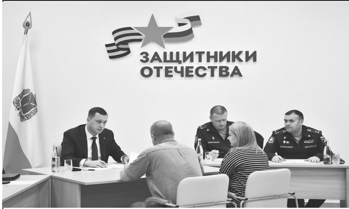
Участники СВО и их семьи могут обратиться за помощью в фонд «Защитники Отечества» по адресу: ул. Киселева, 30/34, телефон 8 (8452) 65-31-31 (с понедельника по пятницу с 9.00 до 18.00).