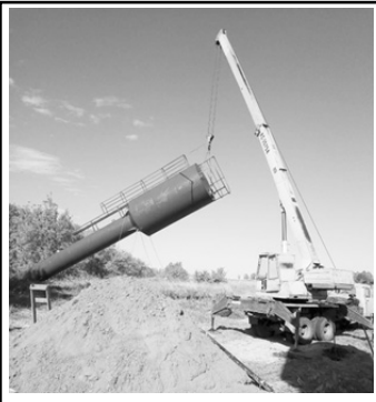
с. Малые Озерки

Во многих поселениях такие водонапорные башни изнашивались, проржавели и наклонились, готовые обрушиться в любой момент. Поэтому именно их замена и стала первоочередной задачей посел-