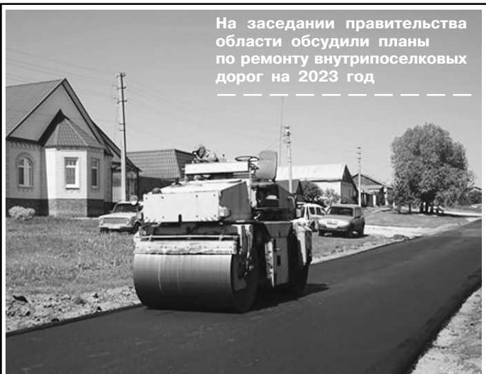
На заседании правительства области обсудили планы по ремонту внутрипоселковых дорог на 2023 год

Специалисты призывают быть предельно осторожными с огнём и помнить о правилах безопасности. В частности, необходимо следить за печами и дымоходами, своевременно их чистить и ремонтировать. Для розжига печей нельзя применять горючие и легковоспламеняющиеся жидкости. Чрезвычайно опасно оставлять топящиеся печи без присмотра или на попечение детей и недееспособных членов семьи. Топить печь следует два-три раза в день; за 3 часа до отхода ко сну топка печи должна быть прекращена – тогда не возникнет опасного перекала. Также необходимо следить, чтобы мебель и занавески находились не менее чем в полуметре от топящейся печи.