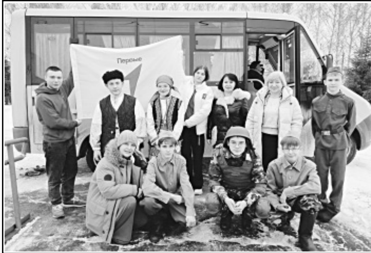
Получатели социальных услуг остались в восторге от творчества юных артистов. Провожа-

Участники акции, юные артисты театральной студии “Арт-Тайм” показали пожилым людям театрализованные мини-сценки: “Письма солдат” и “Василий Теркин” из произведения Александра Твардовского.