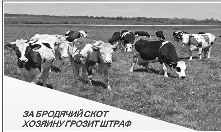
ЗА БРОДЯЧИЙ СКОТ ХОЗЯИНУ ГРОЗИТ ШТРАФ