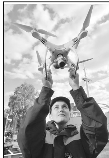
Министерство промышленности и торговли РФ.

В дальнейшем программа с конкретными предложениями по созданию центра в Саратове будет направлена в