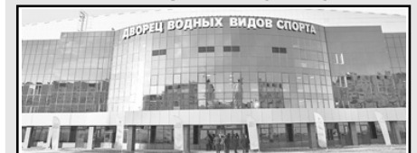
10. Дворец водных видов спорта в Саратове (2021)