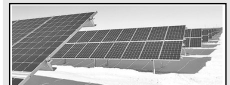
6. Солнечные электростанции ГК «Хевел» в Пугачевском, Ершовском, Новоузенском и Дергачевском районах (2017)