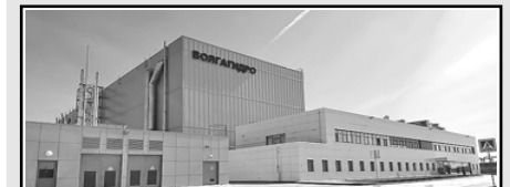
7. Завод гидротурбинного оборудования «ВолгаГидро» в Балакове (2019)