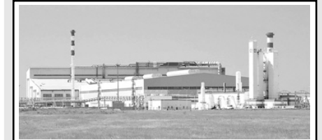
2. АО «Металлургический Завод Балаково» (2013)