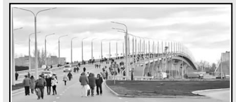
5. Мост Победы через судоходный канал в Балакове (2015)