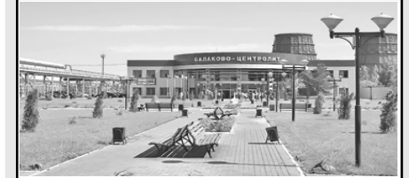
3. АО «Балаково-Центролит» (2014)