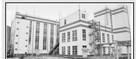
8. Маслоэкстракционный завод «Волжский терминал» в Балакове (2014)