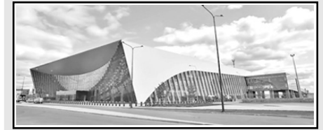
1. Аэропорт Гагарин (2019)

ТОП-10 ОБЪЕКТОВ, ПОСТРОЕННЫХ В 2012-2021 ГОДАХ С НУЛЯ