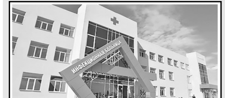
4. Инфекционная больница в поселке Елшанка Саратова (2022)