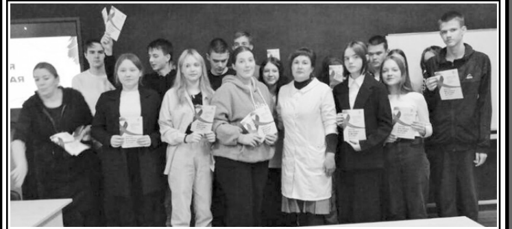
И. ВАСИЛЬЕВА по материалам ГУЗ СО “Новобурасская РБ”.

Встреча прошла в теплой дружеской атмосфере.