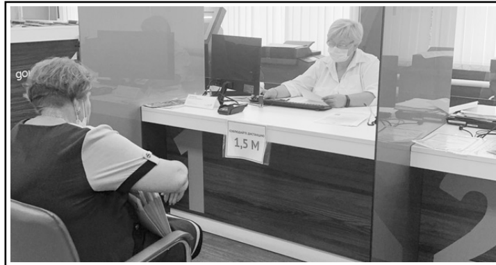
МФЦ ведет прием заявлений