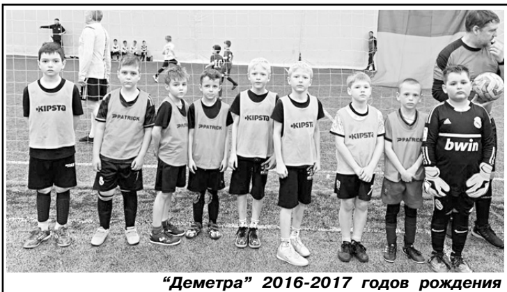
«Деметра» 2016-2017 годов рождения

С марта 2025 года воспитанники Центра развития дополнительного образования – команды «Деметра» 2012-2013 и 2016-2017 годов рождения участвуют в весеннем кубке Первенства г. Энгельса по мини-футболу.