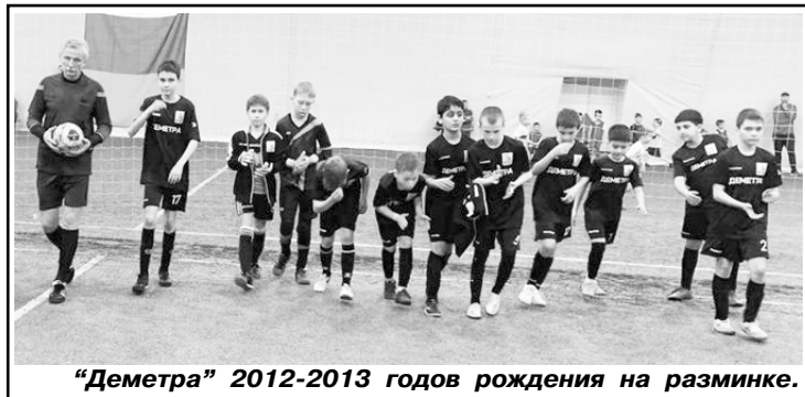
«Деметра» 2012-2013 годов рождения на разминке.

Для самых юных наших футболистов-деметровцев 2016-2017 годов рождения их первые выездные соревнования складываются сложно. Они