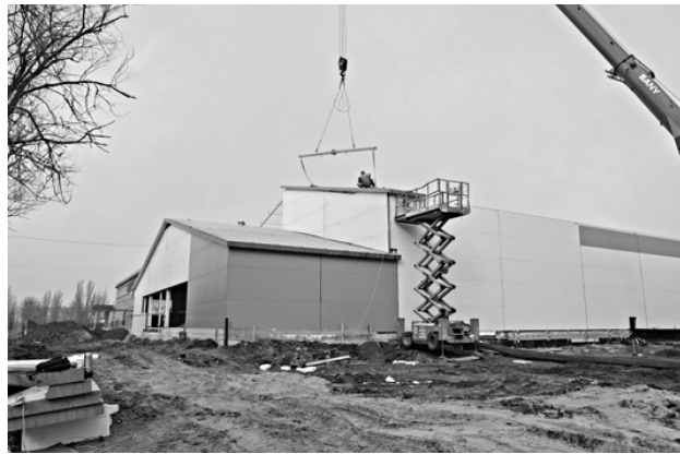
Окончания строительства очень ждали жители.

Ранее на переезде через Песчано-Уметский тракт автомобилисты были вынуждены стоять в многочасовых пробках. С этой проблемой они обращались к Володину – вопрос строительства путепровода удалось решить при его поддержке.