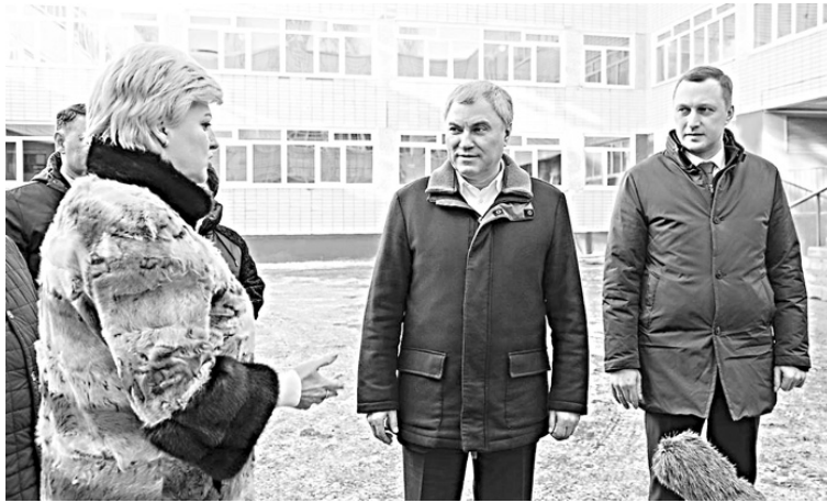
Многие вопросы необходимо решать на месте.

Сейчас в медучреждении установлено современное оборудование. У жителей появилась возможность пройти обследование на компьютерном томографе, на аппарате МРТ, маммографе, сделать флюорографию, УЗИ, и рентген. Открыт аптечный пункт. Первых пациентов новая поликлиника приняла уже весной этого года.