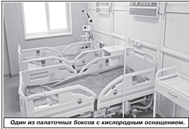
Один из палаточных боксов с кислородным оснащением.

Трехэтажные здания 2 и 4 лечебного корпусов состоят из палатных отделений, расположенных в «красной зоне», и кабинетов врачей и вспомогательных помещений в чистой зоне. Все боксы палатного отделения имеют санузлы и выходы на обходную открытую галерею. Количество боксов в отделении каждого корпуса 16 и рассчитано на одновременное пребывание 30 человек в Мельцевских боксах. Корпуса оснащены лифтами для перевозки маломобильных групп населения.