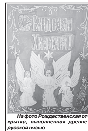
На фото Рождественская открытка, выполненная древнерусской вязью