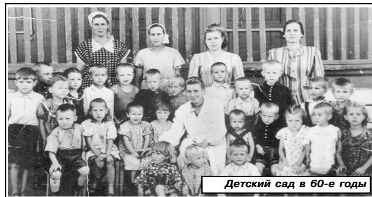
Детский сад в 60-е годы