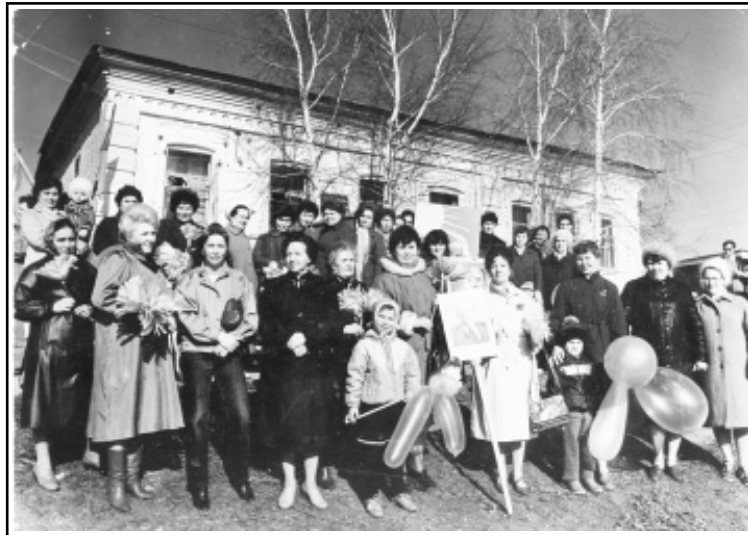
Коллектив Новобураской больницы 1987 г.

году родильное отделение было выведено в отдельный дом, в нем имелось всего 10 коек. Врачей и медсестер не хватало. И только в 1958 году в больнице впервые набрали полный штат сотрудников.