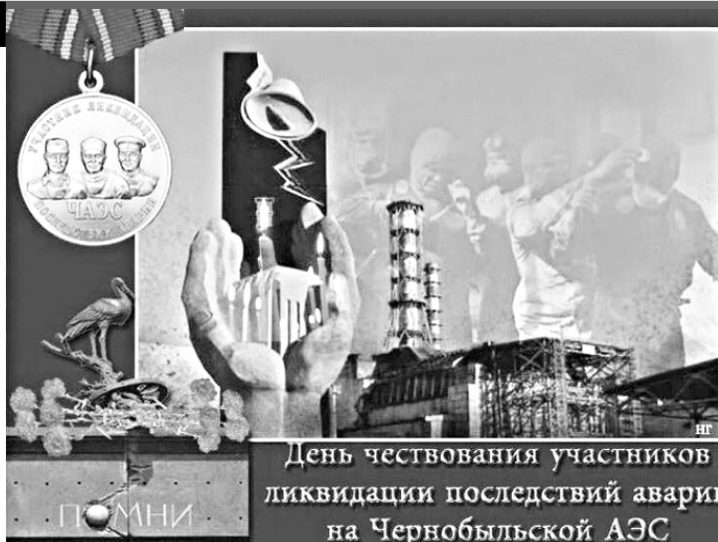
День чествования участников ликвидации последствий аварии на Чернобыльской АЭС

На 25 апреля 1986 г. была запланирована остановка 4-го энергоблока Чернобыльс-