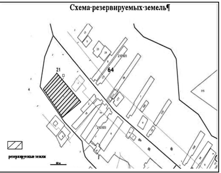
Схема резервируемых земель

Приложение к постановлению администрации Новобурасского муниципального района от 16 июня 2020 г. № 155